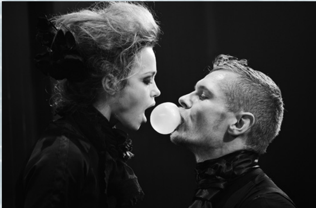
Det Kongelige Teater: "Sonetter" - Instruktion: Elisa Kragerup - foto: Miklos Szabo

Bagside: Balletto di Sofie: "Il Lago Dei Cigni" Foto: Inger Birkestrøm Juul