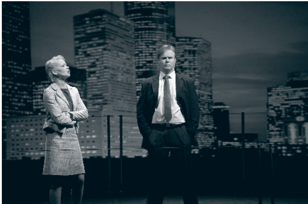
Odense Teater: "Enron" Instruktion: Morten Hovman.

Et lovforslag om ændring af teaterloven ventes fremsat tidligt i 2012.