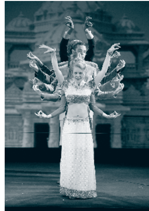
Odense Teater: "Enron" Instruktion: Morten Hovman.