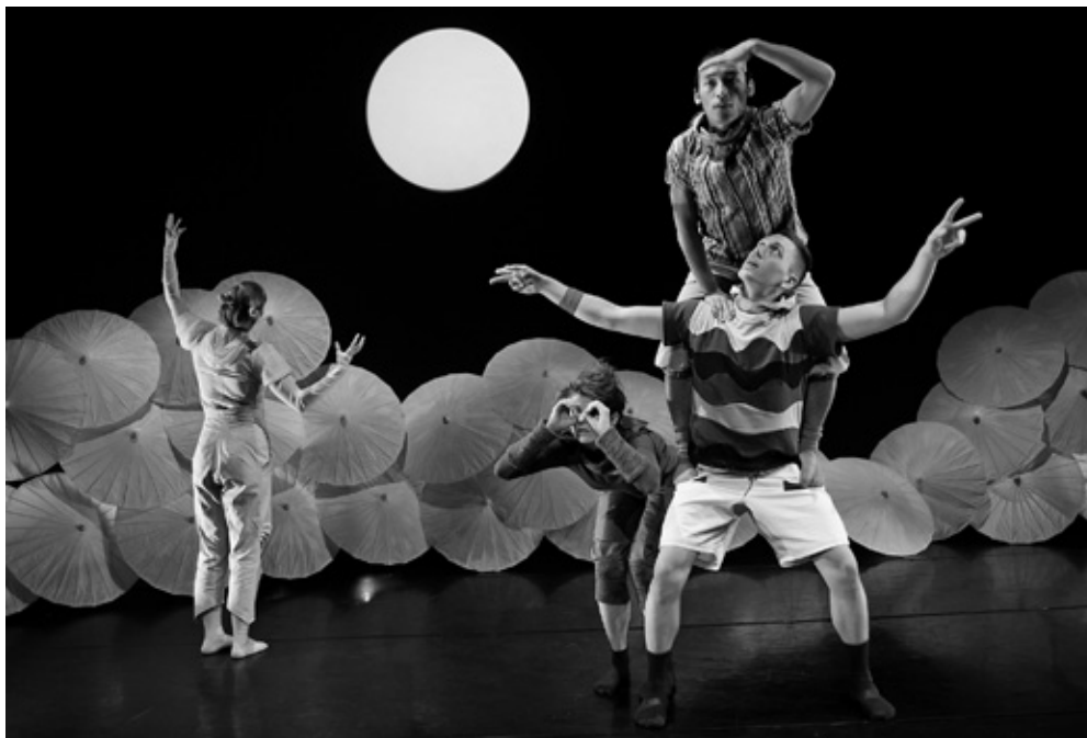
Der er forestillinger for publikum i alle aldre. Her danser de fire årstider henover scenen i forestillingen Hvem kommer først, som var en del CARL Dansefestival for børn og unge.

I april 2011 overtog Bush Hartshorn posten som Dansescenens teaterchef. Bush Hartshorn har et glødende ønske om at tilføre Dansescenen nye projekter og udvikle repertoiret med ét øje mod verden, det andet mod Danmark og med hænderne dybt i