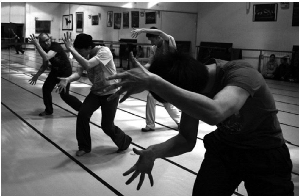
Dansk Danstheater.