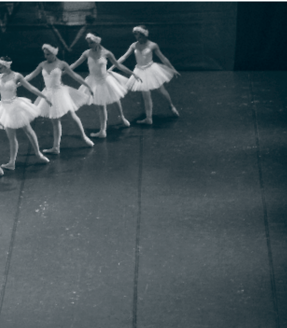
Balletto di Sofia: "Il Lago Dei Cigni"

Programmet beskriver ..."contrasto cui dà corpo Odette/Odile, per un verso simbolo della purezza angelica, per l'altro il suo alter ego diabolico"... vistas overbevisende i ballettens 4 akter – hvor det yndefulde, sarte svanevæsen – hvis smukke vingearme fik bevægelsen fremkaldt i alle, blev stærkt modsagt af den sorte svanes kontrolleret vilde og dæmoniske forførelse. - Den bærende mandlige danser gav klart udtryk for tiltrækningen til de modsatrettede aspekter og landede kønt på benene, ud og ind mellem et ret stort compagni af fugle i mængder.