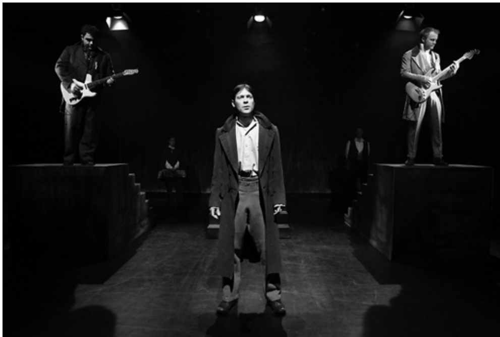
Grønnegade Teater: "Forbrydelse og straf" Instruktion: Hans-Peter Kellner

vidne til en diskurs, som den unge Rodion først og fremmest fører med sig selv, om sine egne principper og tvivler. Og det synes jeg er et meget vigtigt aspekt: At man ikke hele tiden sætter sig selv i relation til, hvordan andre gør, hvad de synes er tilladt eller ej, men at man finder sin egen vurdering, er i kontakt med sin egen fornemmelse. En etisk bevidsthed, som er modstandsdygtig overfor radikale indflydelser.