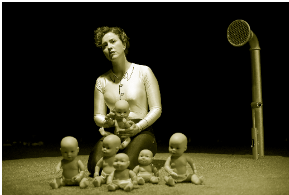
Aarhus Teater: "Det normale liv" Instruktion: Anne Zacho Søgaard

Det Kongelige Teaters regnskaber er ikke konteret adskilt mellem kunstarterne for en række fællesfunktioners vedkommende, eksempelvis bygningsdrift og ledelse. Udgifterne til disse fællesfunktioner inklusive bygningsdrift er indregnet i Søndag Aftens analyse, baseret på en forholdsmæssig beregning ud fra de forskellige formål i teatrets samlede drift (når skuespillet ved Det Kongelige Teater udgør 18,5% af de formålsbestemte nettoudgifter, antages skuespillet også at udgøre 18,5% af de ikke-formålsbestemte nettoudgifter).