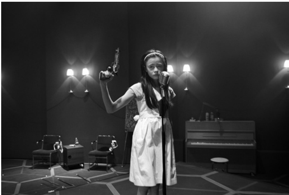
Det Kongelige Teater: "Revolvertrilogien" Instruktion: Rune David Grue

Repertoire-dramaturgens opgave er i samarbejde med teaterdirektøren at få lagt det kommende års repertoire. Det kræver at dramaturgen holder sig opdateret, i både