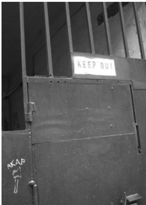
Den lukkede indgang til Raskolnikovs hus.

tegne sig et billede af det Rusland Dostojevskij har beskrevet i Forbrydelse og straf . En verden af ekstreme modsætninger i en for mig hidtil ukendt kulturkreds, som jeg langsomt begyndte at forstå en smule af, ikke mindst gennem mange samtaler med de venlige, åbne, imødekommende og veluddannede Skt. Petersborger.