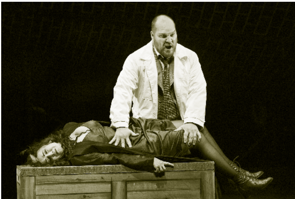
Det Kongelige Teater: "Parsifal" Instruktion: Keith Warner

Lige godt og vel 60 % af de samlede besvarelser har arbejdet som professionel instruktør i mere end 15 år.