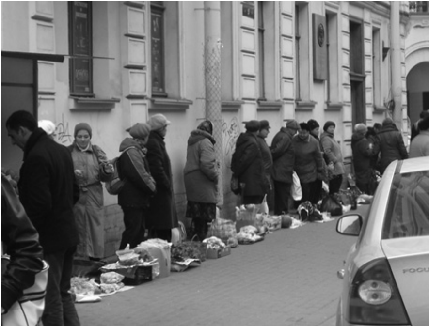
Persille, kartofler, tranebær fra kolonihaven til salg for et par rubler.

og som er fyldt med guldbelagte dekorationer og kunstskatte.