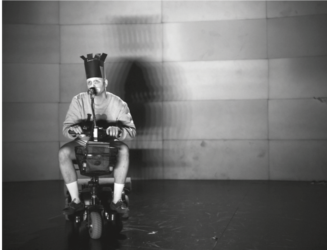
Aalborg Teater: "Røverne" - Instruktion: Therese Willstedt - Foto: Mathies Brinkmann Jespersen

Historisk set har teateruddannelsen bygget på en solid mesterlæretradition. Elevskoler for skuespillere har eksisteret så længe der har eksisteret teatre. Det var en gang en selvfølgelig opgave for professionelle skuespillere på teatrene, at være dem, der rekrutterede efterfølgere. De unge elever lærte af de store "mestre" ved at se dem spille og tage ved lære af deres erfaringer.