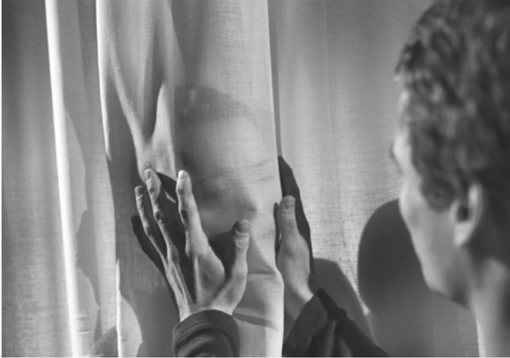
Det Kongelige Teater: "Madame Bovary". Instruktion: Elisa Kragerup

fra det brede, mangfoldige scenekunsthelt, der kan tælle alt fra de største teatre til de helt små enmands-produktionsenheder, og som spiller kvalitativt ind i den store omverdens