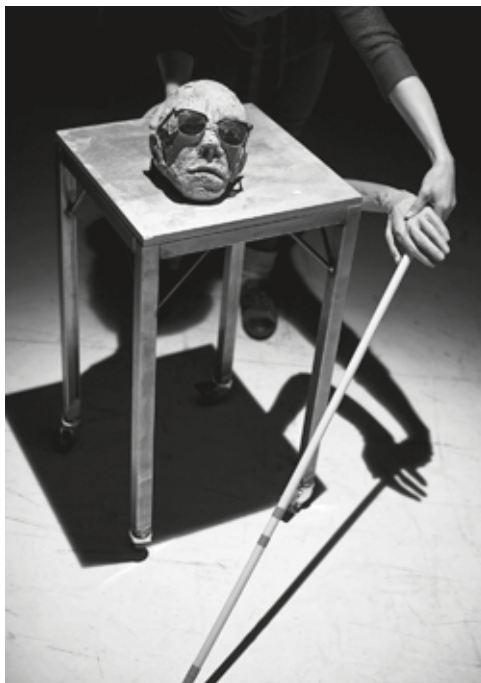
Bådtæret: "Odysseen" Instruktion: Rolf Heim

Forudsætningerne for denne videreudvikling af scenekunsten er de bedste: Tiderne er anderledes i dag end de var, da Teaterskolen var ung i 1968. Oprøret fra dengang er langsomt stilnet af. Men viljen til at udnytte studietiden til at skabe en platform for sig selv som skabende og udøvende kunstner inden for dans, teater, film, performance og