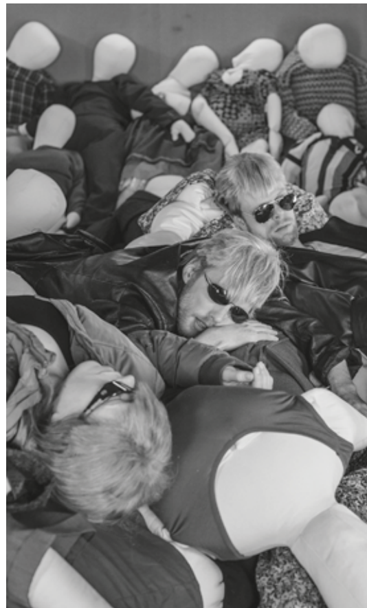
Aarhus Teater & CafeTeatret: "Skakten" Instruktion: Tue Biering

Dans, teater, opera og performance-teater (etc.) må tale sammen, arbejde sammen, inspirere hinanden. Det er i et sådant miljø, paradigmeskiftets realitet og nødvendighed bliver synlig.