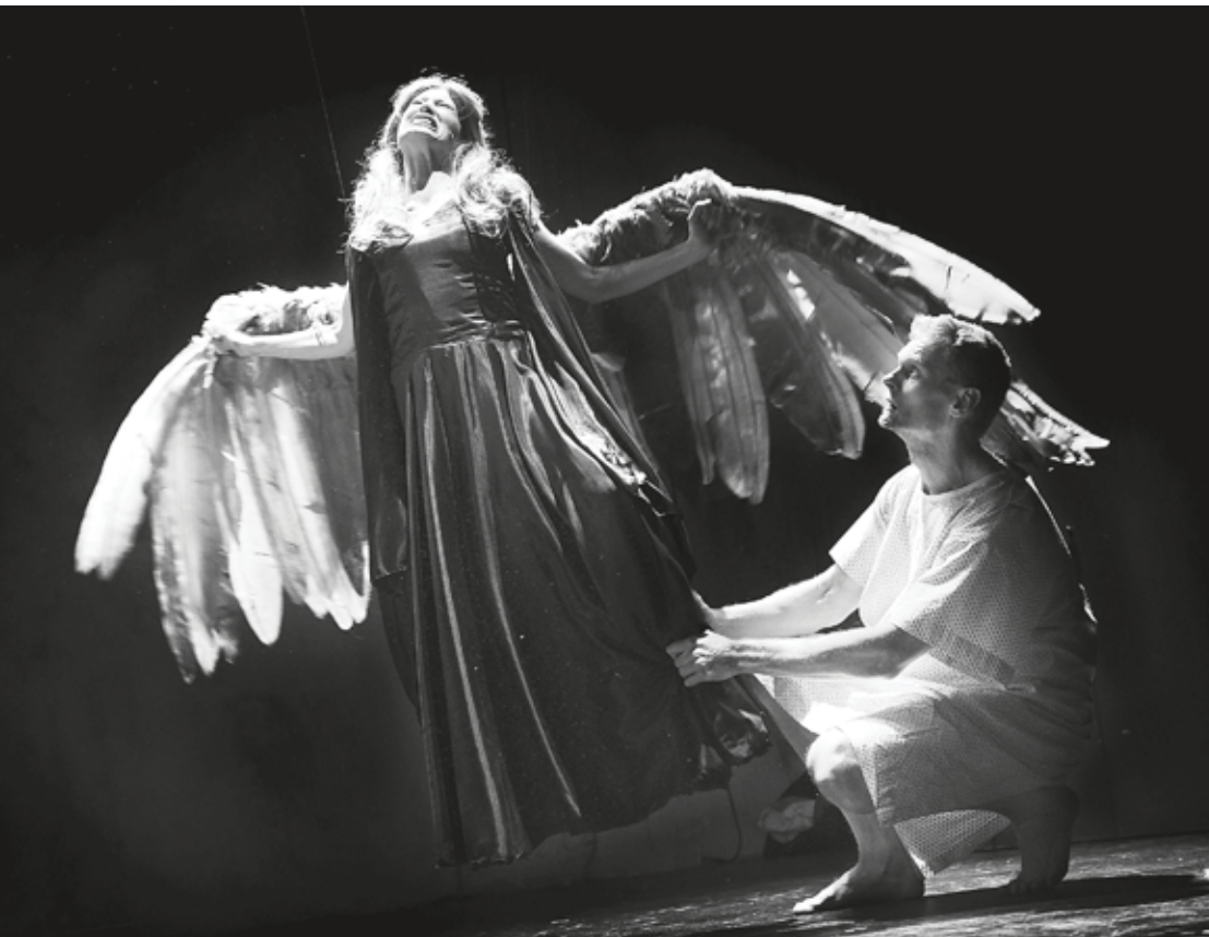
Edison: "Engle i Amerika" - Instruktion: Christoffer Berdal

gerne skabe et levende miljø for kunstnerisk udviklingsvirksomhed eller forskning, der tjener udviklingen af kunstarten. Den vil gerne indbyde branchens bedste udøvere til et højere lærested, hvor der er plads til at forske og eksperimentere. Skolen er allerede et mødested for en stor gruppe dygtige scenekunstnere og eksperter, der underviser på alle fagområder. Den vil gerne gøre det endnu mere eftertragtelsesværdigt at medvirke til uddannelsen af den nye generation. Den vil gerne skabe tættere samarbejdsrelationer mellem skolen, teatrene og dansekompanierne.