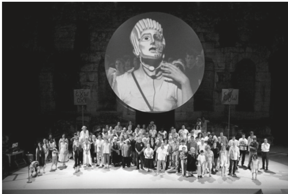
Prometeus - Rimini protokol

Efteruddannelsen blev oprettet i 2003, da kulturministeriet ønskede at nogle andre end fagforeningerne varetog scenekunstnernes efteruddannelse. Umiddelbart var der vrede reaktioner fra fagforeningerne, da der blev