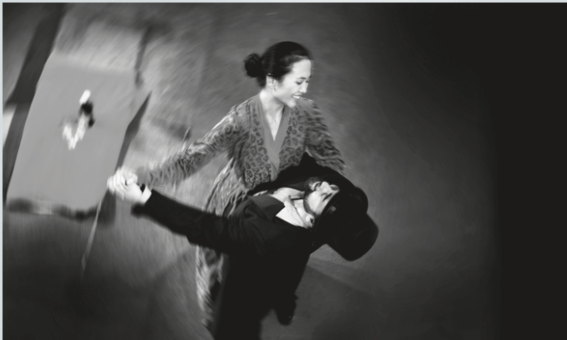
DanskDansk: "Frelserne" - Instruktion: Moqi Simon Trolin

Forside: Det Kongelige Teater: "Hovedløs sommer" Instruktion: Madeleine Røn Juul