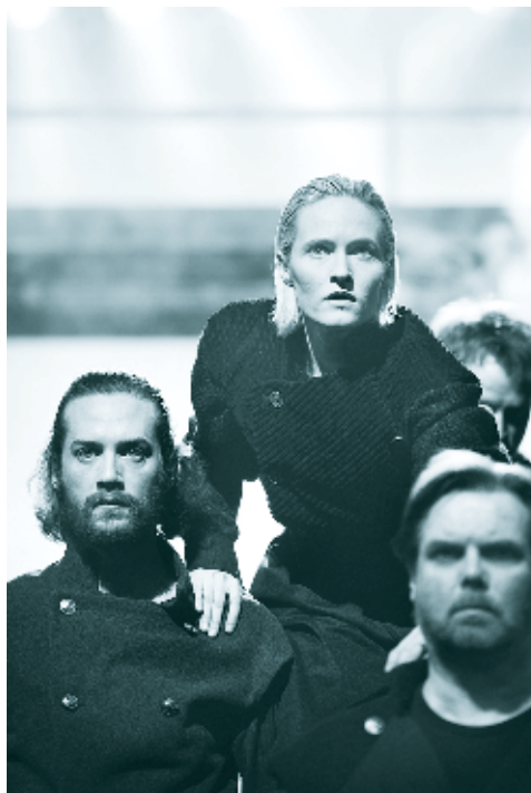
Odense Teater: "Jeanne D'Arc" Instruktion: Inger Eilersen

Den største fordel består i, at afkastet beskattes med den lave sats på 15,3 procent. Derudover giver det ekstra fleksibilitet i pensionstilværelsen at have en vis opsparing, som frit kan bruges efter behov.