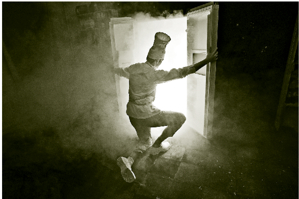
Teater Fair Play: "Lyde i natten"

Oplæggene endte med en livlig debat med spørgsmål og indlæg fra tilhørerne. En kvindelig deltager fra Sydafrika talte blandt andet om, hvordan alle teaterprojekter i en