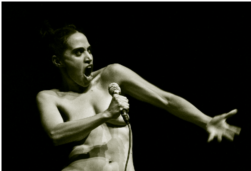
La Merda - Foto: Valeria Tomasulo

CPH STAGE præsenterer i år lidt over 300 arrangementer på 12 dage, og man kan læse om dem alle sammen og se det endelige program på festivalens hjemmeside www.cphstage.dk