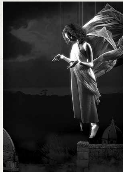
Bådteatret: "Testamentet" Instruktion: Rolf Heim

Er der rettelser, så kontakt sekretariatet.