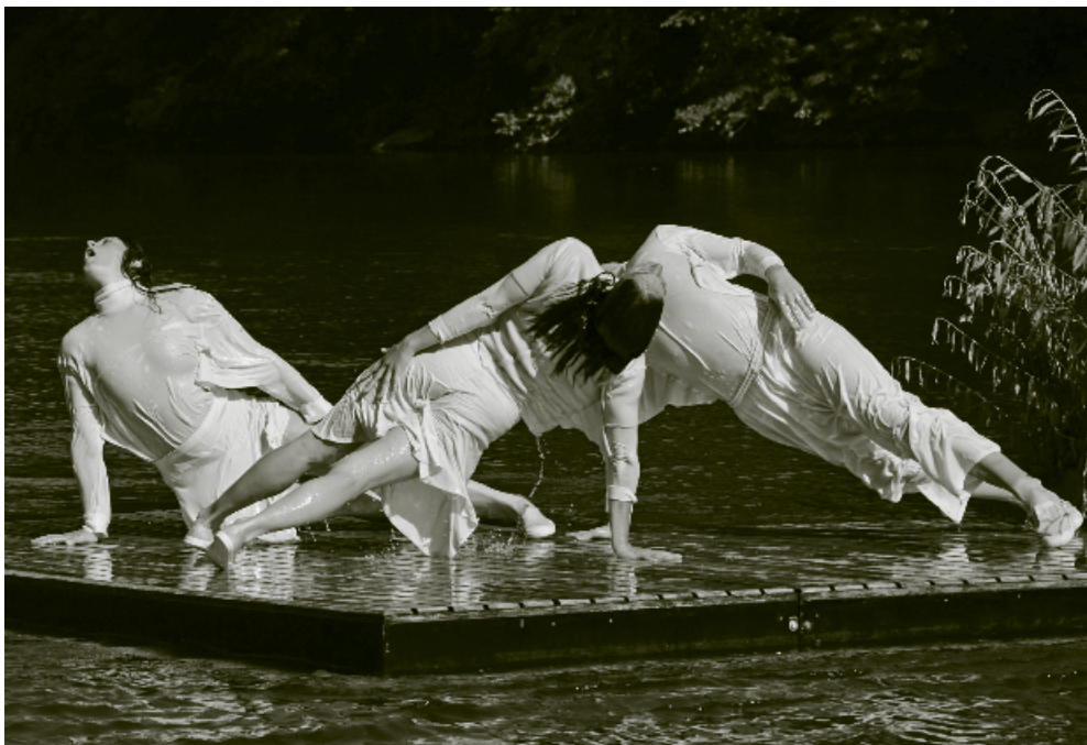
Studio Eclipse forestilling "Two Sink, Three Float" er en danseforestilling i vand. Forestillingen opføres ved Dunkers Kulturhus i Helsingborg og i Kulturhavnen i Helsingør.