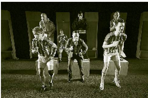
Aalborg Teater: "AAB for altid" Instruktion: Minna Johannesson

Send en mail med en kort beskrivelse af formål og søgt beløb til sekretariatet. Henvendelser behandles løbende.