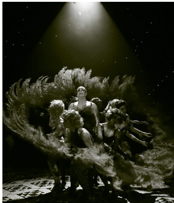
Ålborg Teater: "Cabaret" Instruktion: Rolf Heim

Derudover har jeg undervist på Teaterskolen og arbejdet for efteruddannelsen.