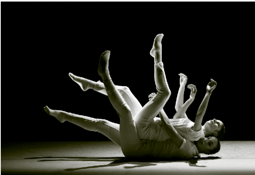
La Veronal

med forestillinger fra det frie scenekunstmiljø, Teaterøens Teaterøen på CPH STAGE og Nycirkusfestivalen Smag på dansk nycirkus.