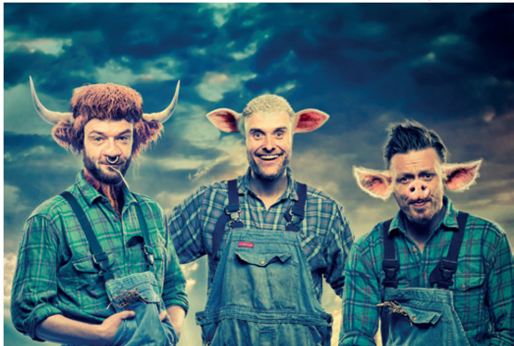
Von Baden: "Umælende kræ" - Fotograf: Morten Fauery

Der er tid til at udvikle den forretningsmodel der kan få det til at ske.