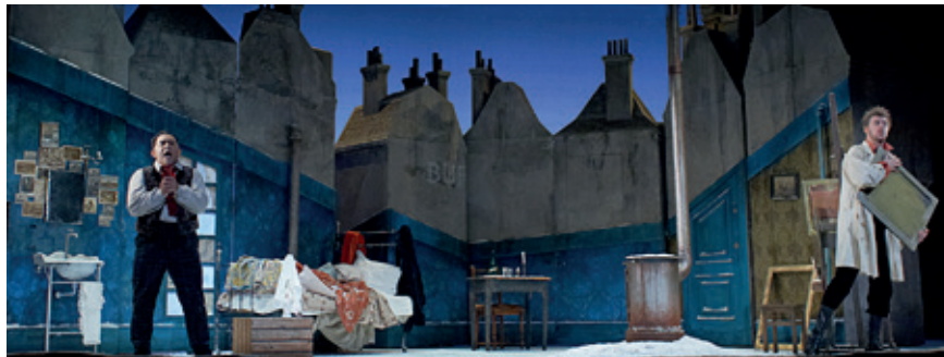
Den Jyske Opera: "La Bohème" - Instruktion: Annilese Miskimmon

Så planen er at fortsætte udgivelsen, men arbejde på at skabe et velfungerende internet alternativ i fællesskab med de øvrige forbund.