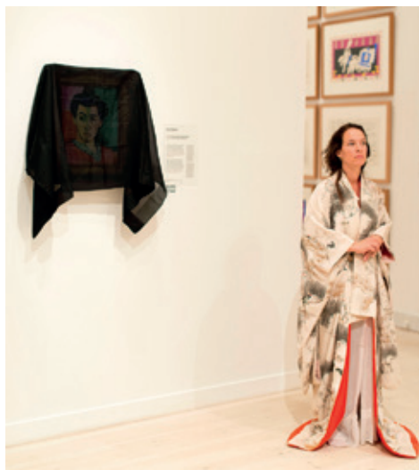
”9x9x9” instruktion: Hans-Peter Kellner

9x9x9 er et nyt stort cross-over projekt som den østrigske instruktør Hans-Peter Kellner har bragt til Danmark.