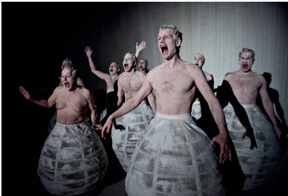
Aalborg Teater: "Beton" - Instruktion: Nicolei Faber