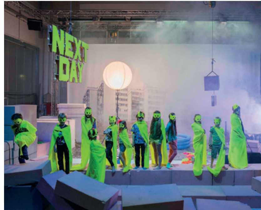
Campo: "Next Day" - Instruktion: Philippe Quesne - Foto: Martin Argyroglo