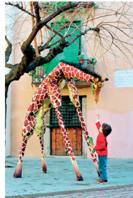
"Girafes" Spring Festival 2016