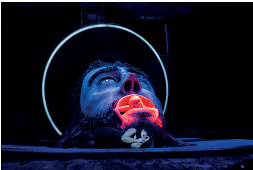
Det Kongelige Teater: "Salome" - Instruktion: Stefan Herheim