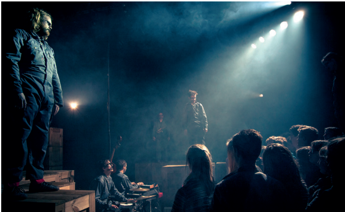
Nørregårds Teater: "Bolbronx" - Instruktion: Nils P. Munk