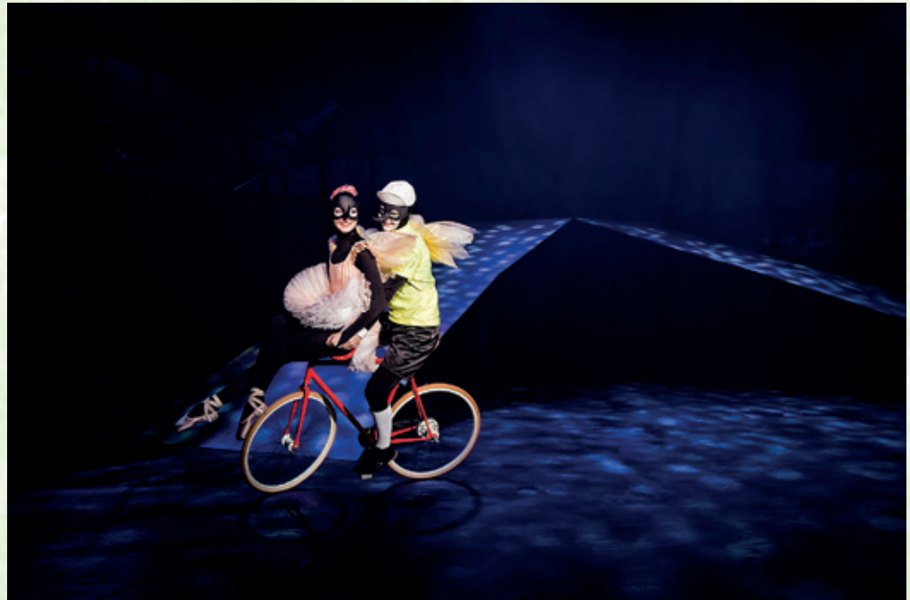
Østre Gasværk Teater: "Cykelmyggen Egon møder Tommelise" Instruktion: Steen Koerner