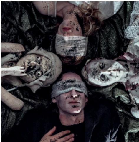
Sew Flunk Fury Wit: "STØV" Instruktion: Jesper Pedersen

"Støv" er en hybrid og svær at kategorisere: Fem fascinerende, menneskelignende dukker, en strålende operasanger og en skyggeagtig karakter fortæller historien om en verden efter civilisationens undergang