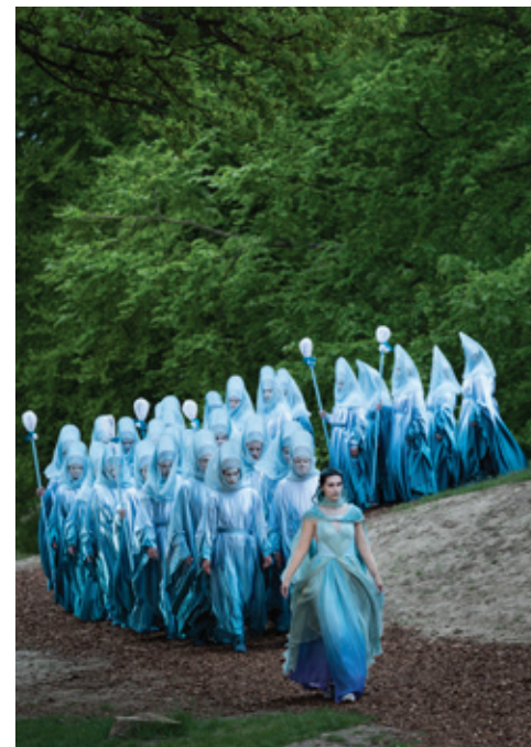
Det Kongelige Teater: "Kong Arthur" Instruktion: Heinrich Christensen

Hvis du er i tvivl om hvad du siger ja til, er det altid en god ide at sende kontrakten, forbi Steen inden den skrives under.