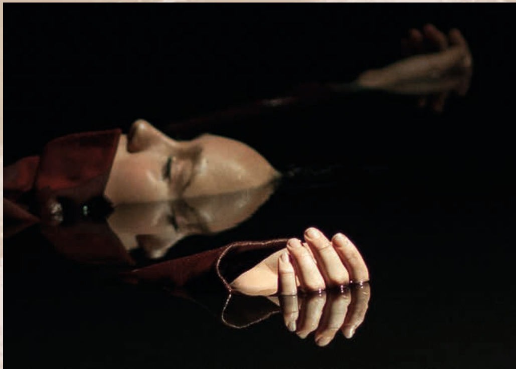
Scenekunstscolerne: "Andronicus" - Instruktion og foto: Henrik Grimback

Bagside: Nørrebro Teater: "Den danske borgerkrig 1814-1815" Instruktion: Jacob Schjødt Foto: Ulrik Jantzen