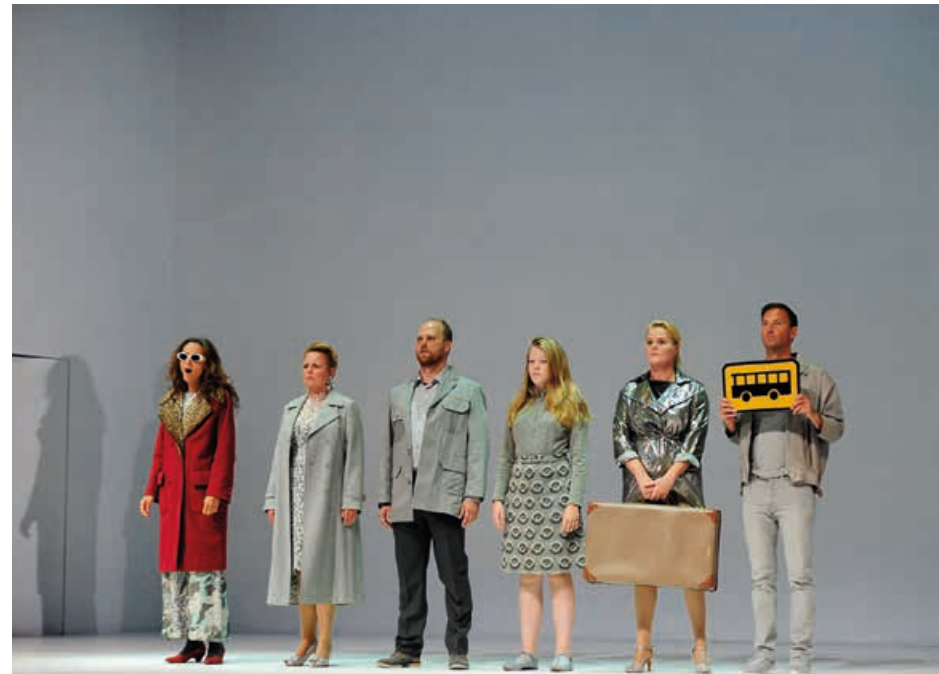
Den Ny Opera: "Don Juan" - Instruktør: Katrine Wiedemann

Prismodtagerne får ud over Reumert-statuetten (skabt af kunstneren John Kørner) følgende summer: Hædersprismodtager: 200.000 kr. Talentprismodtager: 35.000 kr. Prismodtagere i øvrige kategorier: 40.000 kr