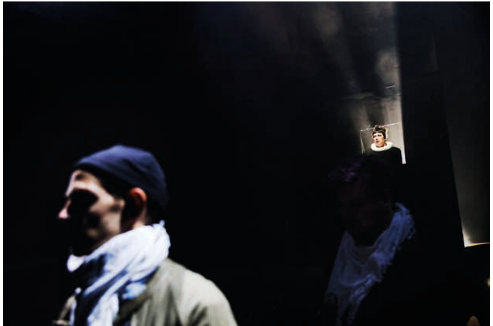
Nørrebro Teater: "Den danske borgerkrig 2018-24" - Instruktion: Jacob Schjødt