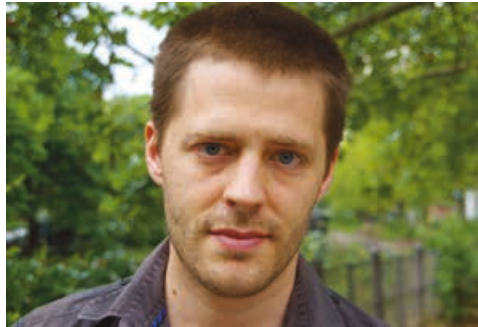
Portrait by Beatrice Fleischlin

comes from his practical work. “I have not studied applied theatre science, so I needed to learn conceptual work by doing – of course without neglecting theoretical knowledge that colleagues brought in or that I researched. In order to develop a concept, it can be helpful to understand the pre-sets of a work.” I ask Andreas what he means with pre-set. “At the Danisch School of Performing Arts , most of the