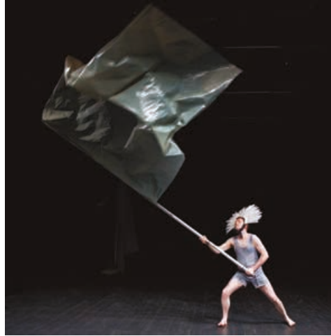
"We-a solo" Production HAU Berlin / Rote Fabrik Zürich 2012, Foto by Benjamin

can I work with the structural pre-sets in order to make them more than an assemblage of their crafts? How can I break my clichés of my own work and work consciously with and against the traditions within the theatre institution? How can I reach a result where all crafts stand behind the artistic need and not in front of it? Sometimes it is needed to change some presets to have a stronger artistic result. Why not, for example start out with only a sound designer and one actor? How closely can the pre-sets be designed according to my concerns this time? In the process, I can then decide whether there is a need for more people, a choir, a light designer, or nothing more at all; whether we will do the performance in a black box or in a public bus.