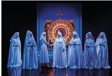
Aalborg Teater: "The Sound of Music" Instruktion: Rolf Heim

Dramaturgens vigtigste funktion er at være den parabol på taget af teatret, som indfanger hvilke strømninger der er derude og hvad der sker i verden og evner at omsætte det til teater.