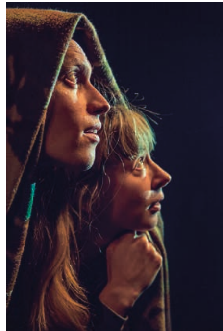
Fair Play: "Soldaten"

Søndag d.22. April 11.15, 50 minutter: SOLDATEN, FAIR PLAY. Spillested: KVADRAT, Showroom. Locationen er en oplevelse i sig selv; heldigt at komme i god tid - og at kunne nå at nyde dette arkitektoniske under, beliggende i et mageløst landskab. Virksomheden rummer en ypperlig og verdenskendt produktion af unikke, uldne møbelstoffer. Alle rum er fyldt med gedigen kunst, og exterriørt iscenesat med 5 vanddækkede spejlflader anbragt i naturlandskabet, med får, siddearrangementer og