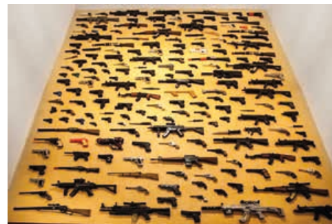
"Verdensrum" – en sansemættet rejse i danskhedens og fremmedangstens labyrint.