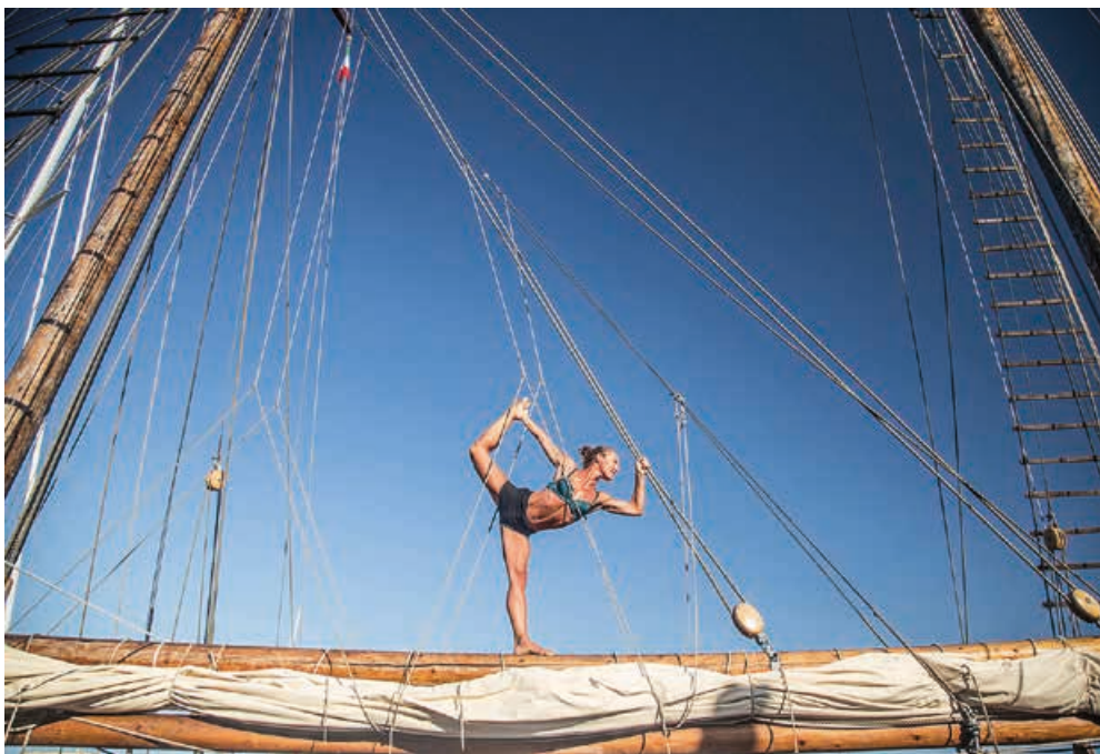
Asterions Hus: "Min Odysse" - Pressefoto

som ny Chef, Det Kongelige Gamle Scenes udgiftsbyrde, møder, økonomi, og igen: alle videre til denne FESTIVALs forestillinger og gatherings.