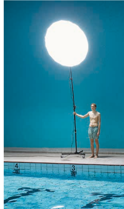
Teater Momentum: "OS"