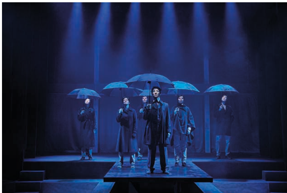
Odense Teater: "Forårsrollen" - Instruktion: Martin Lyngbo