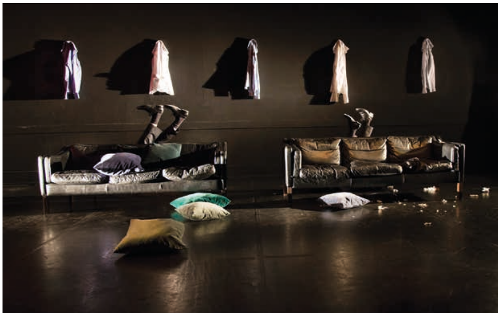
I "Kom Du?" sættes prostitueringskunders skam, lyst, magt, løgn og sanselighed ind i en æstetisk billedsmuk ramme.

Wuppertal med enkle og smukke greb i et hav af rød-orange efterårsblade en række rammende, morsomme og poetiske bud på paradokserne, klicheerne og det komiske i mænds og kvinders overgangsalder. Og i "Kom Du?" trækker hun kritisk, men også kærligt forskellige sider af den mandlige prostitueringskundes virkelighed frem, for – i et stilfuldt mandeunivers med lædermøbler og vægophængte skjorter – at belyse generelle menneskelige temer som fx værdighed, skam, nærhed og menneskelig kontakt.