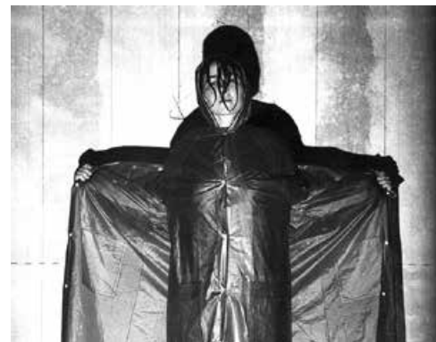
"Piano Piano" – en voksenforestilling med stemning, fantasi og bevægelseslyst.

betagende teatermagi ved at lade sig undre og inspirere af fx østerlandsk filosofi og digtning, samiske eventyr og inuit kultur, Fluxus kunst og italiensk opera. Mange af forestillingerne var målrettet børn og unge. De spillede i årevis i Danmark og turnerede vidt omkring udenlands.