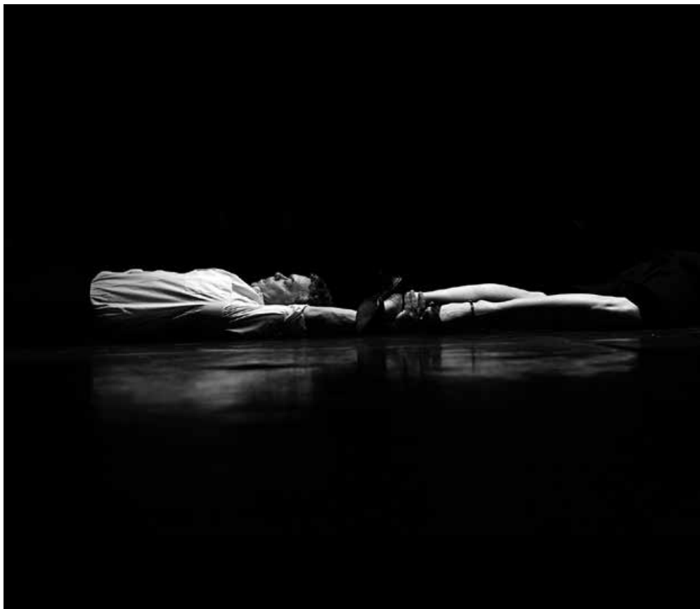
I "Himmel og Jord" forenes det fysiske sanselige med æstetiske raffinementer.