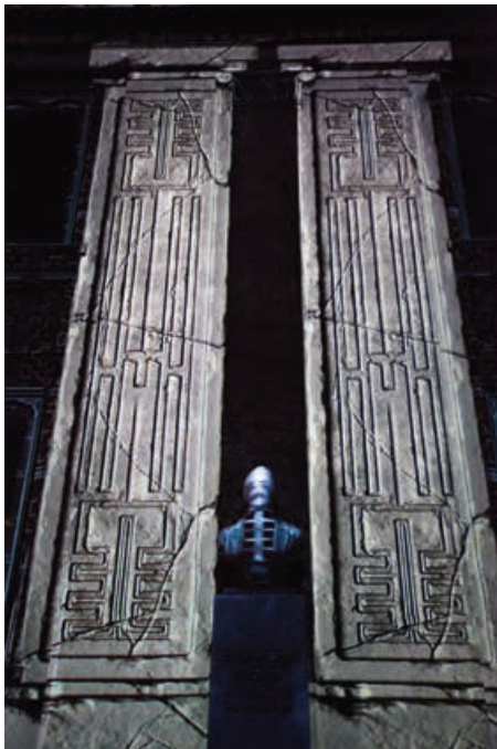
Steen og Hejlesen og Den Sorte Skole: "Unitopia"

Vi har i bestyrelsen for Danske Sceneinstruktører etableret et initiativ for nye kollegæer i branchen, hvor de kan søge hjælp eller gode råd i alle tænkelige situationer omkring instruktør arbejdet, hvor forbundet ikke kan hjælpe. En slags akutlinje når man står i en situation og ikke ved hvad man skal gøre. Det kan være en lønforhandling, problemer i forhold til en teaterdirektør eller en skuespiller eller kunstneriske problemer af forskellig art.