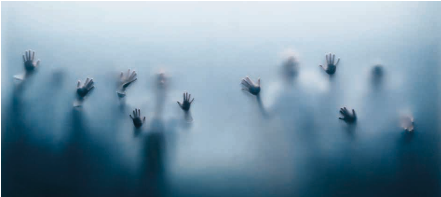
Det Kongelige Teater: "Riget" - Instruktion: Nicolei Faber