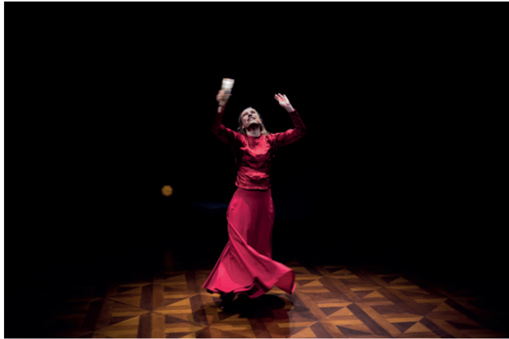
Vendsyssel Teater: "Et dukkehjem" - Instruktion: Kaspar Rostrup - Foto: Jacob Stage

I lysets udpegning og dækning af stemninger, det auditive univers formuleret af Fuzzy, skuespillet tro mod d.4.vægs princip - er publikum følelsesmæssigt vidnesat til et kunstnerisk teatralt laboratoriums udlægning af Ibsens tekst og indsigt, talt og vist af skuespillerne i Kaspar Rostrups arena.