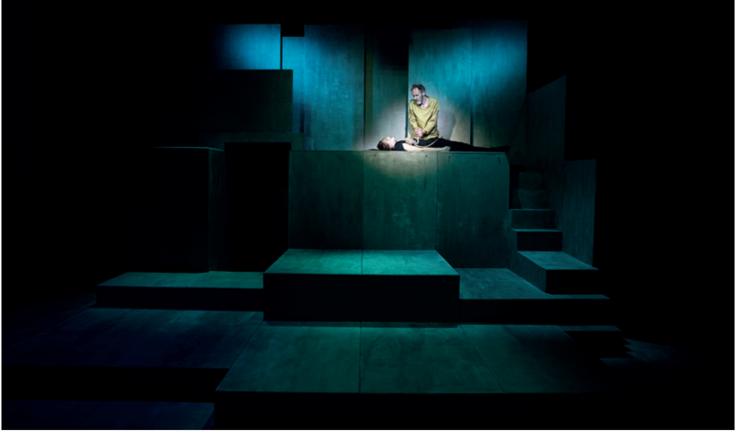
Teater Nordkraft: "Kong Lear" - Instruktion: Mikkel Harder Munck-Hansen