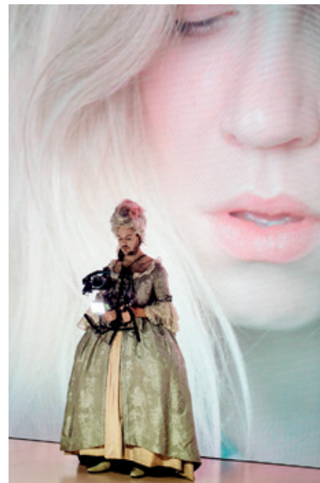
Jesper Just: "Cadavre Exquis"

Aftalen mellem de involverede partier medfører samtidig, at man opsiges en række tidligere teaterpolitiske aftaler. Det gælder blandt andet aftalen fra juni 2011, som havde til hensigt at etablere en åben scene i København.