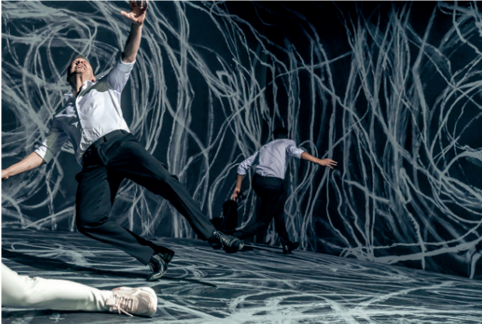
Det Kongelige Teater: "De fulde" - Instruktion: Staffan Valdemar Holm

bevillingen til administrationen af teatersamarbejdet. Selv om det er en mindre beskæring af tilskuddet til teatersamarbejdet (forslaget var netto 2,6 mio. kr. besparelse), så er det en kraftig besparelse ud af nuværende administrative udgifter på 4,5 mio. kr.