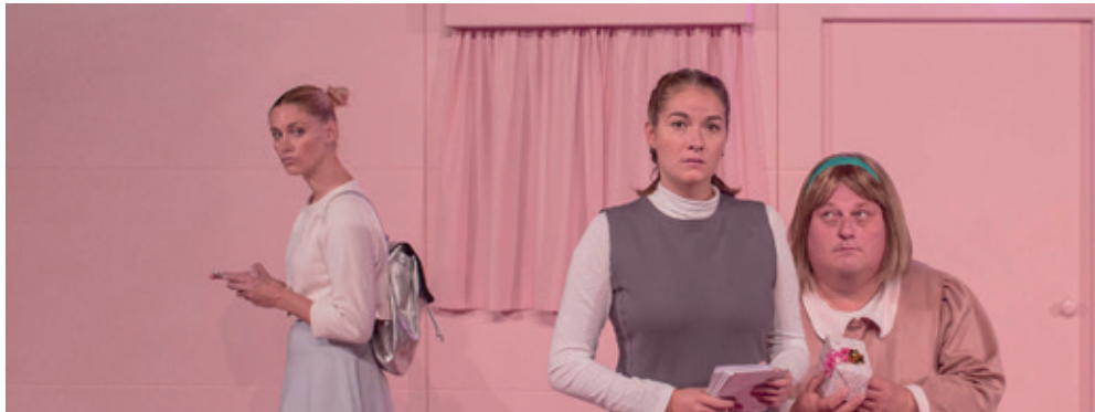
Teater Hils din mor: "Fucking Åmål" - Instruktion: Mia Lipschitz - Pressefoto

”Det er min første gang i teatret. Jeg havde taget pønt tøj på for det troede jeg man skulle når man gik i teatret. Men alle personer på scenen var jo ligesom mig så det havde jeg slet ikke behovet. Det var vildt fedt. Ligesom at være til koncert med et fedt band. Man ku’ kende sig selv og jeg fik vildt lyst til at danse”