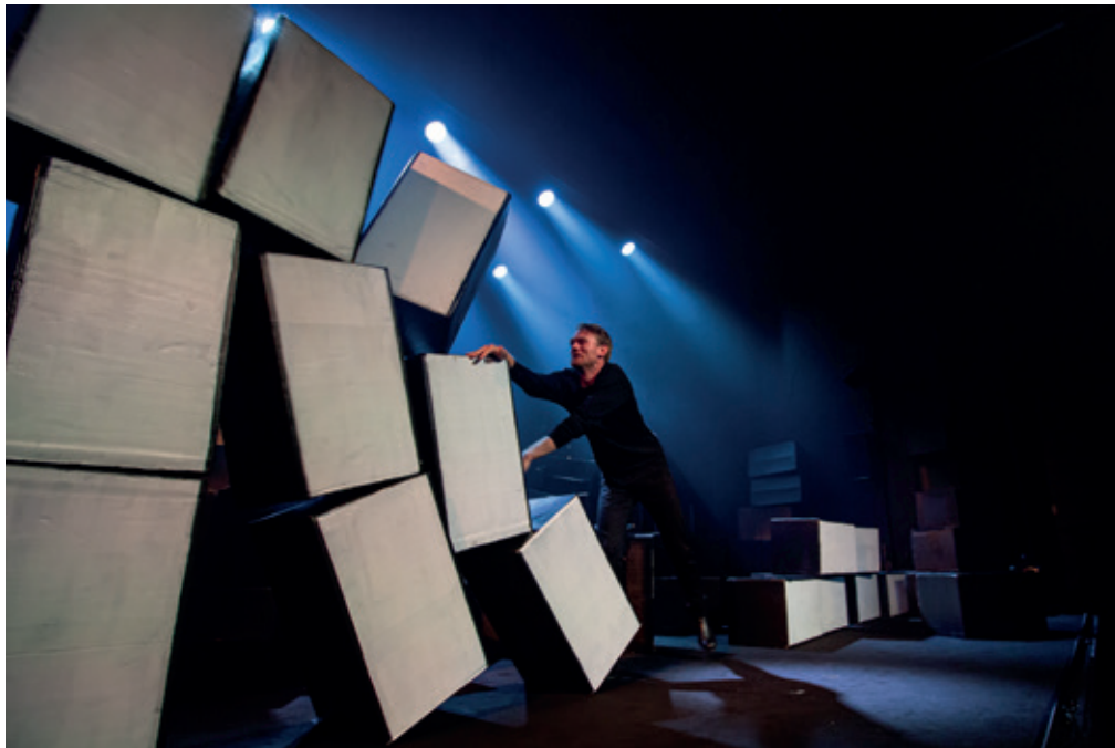
Teatret Svalegangen: "Troen og Ingen" - Instruktion: Per Smedegaard - Pressefoto

Sætte tidens tanker og følelser i bevægelse, i et moderne scenekunstsprog, med et reelt ønske om at ville nå et publikum.