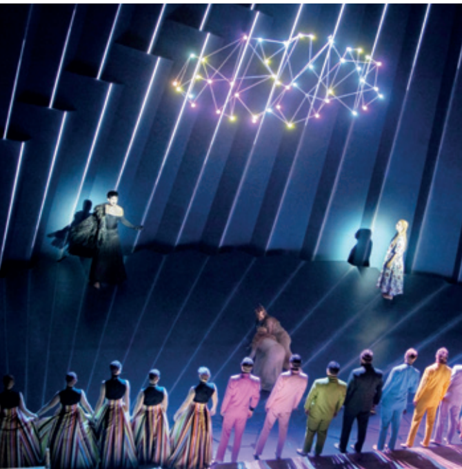
Det Kongelige Teater: "Snedronningen" Instruktion: Francisco Negrin

og guldkroner flyder rundt på gulvet hvortil pigen inviteres til et mere kødeligt henslængt indendørs liv. Euforien supportes med yndige opiumspiber og svimmelheden er mærkbar, til pigens gode hjerte og ubestikkelige sjæl bryder ud af endnu en forsinkelse og stiler mod sit oprindelige forehavende: at finde sin ven.