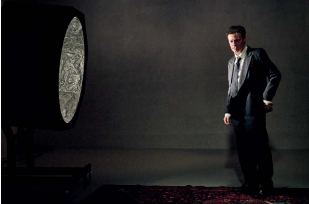
Husets Teater: "Vort mismods vinter" Instruktion: Andreas Dawe

De 5 tekster som vi - i første omgang - har valgt at udgive, er følgende: