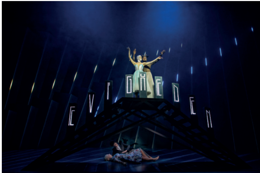
Det Kongelige Teater: "Snedronningen" - Instruktion: Francisco Negrin

Avantgarden og forstandens musik er i slægt med isens molekyler og arktiske egne særegne lydunivers. Stemmerne og kropsliggørelsen af eventyrets figurer overskrider sædvanedefinitioner af køn: drengen er en pige, snedronningen en mand, slotskragen en mand - alle væsener i et kunstigtkunstnerisk univers. - Replikkene som tekstes operæn igennem er taget direkte ud af HCAndersens oprindelige tekst, og en sekvens fra Klods Hans finder finurlig plads i Gerdas rejseforløb. - SNEDRONNINGEN fremstår som et af H C Andersens mest komplekse eventyr, og inviterer til særlige snit og tolkninger som her, hvor musikken, sangene og lyset taler fritskrabet klart og skarpt.