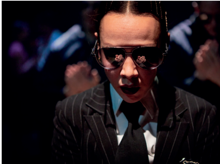
Betty Nansen: "Bonnie & Clyde"

Foreningen forventer en skriftlig afrapportering til eventuelt brug i Det Postomdelte Fagblad.