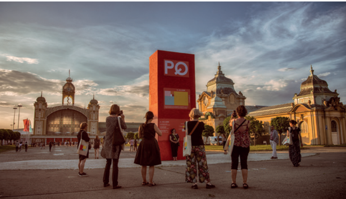
Et oprids af Prague Quadrennial 2019