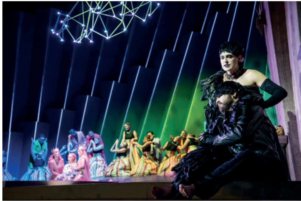
Det Kongelige Teater: "Snedronningen" - Instruktion: Francisco Negrin - Foto: Per Morten Abrahamsen

I II. Akten møder hun en Skovkrage der gør anstalter uden held, og som efterfølgende bringer Gerda til Slottet, hvor hans kæreste: Slotskragen residerer. Slotskragen / kontratenoren er dekadent-forfinet, og den der på frihedens tærskel siger Ja! til fastansættelse på Slottet. - Den embedstækkede fuglefrihed fører dog til mødet med Prinsen og Prinsessen - tenor og koloratur - der i hudfarvede trikoter