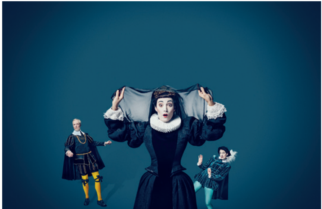
Odense Teater: "Helligtrekongersaften" - Instruktion: Jens August Wille

Forside: Teater Hils din mor: "Fucking Åmål" Instruktion: Mia Lipschitz Pressefoto